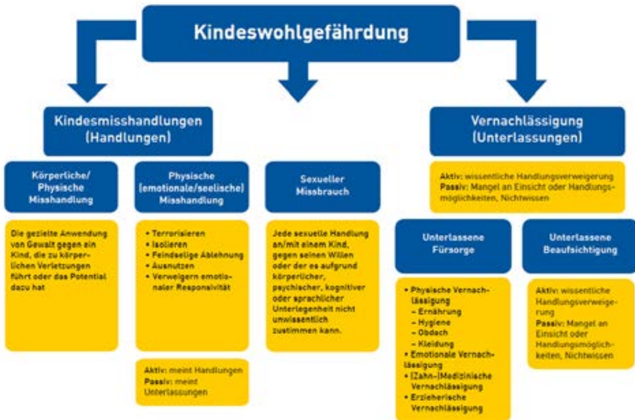
Abbildung 2 Stadt Mannheim Jugendamt [nach Leeb et al. 2008]

Anhand dieses Schaubilds vom Jugendamt Mannheim, soll aufgezeigt werden, in welchen Bereichen Kindeswohlgefährdung nach §8aSGB zu beobachten ist. Anschließend folgt von uns ein konzentriertes Schaubild, wie grundsätzlich die Verfahrensabläufe sind. Die Abläufe sehen so aus, dass bei akuten Fällen, Schritte übersprungen werden können oder bei nicht bestätigten Fällen weitere Schritte nicht eingeleitet werden müssen. Anschließend werden noch mal wichtige Anmerkungen bei Übergriffen von unterschiedlichen Personengruppen genannt.